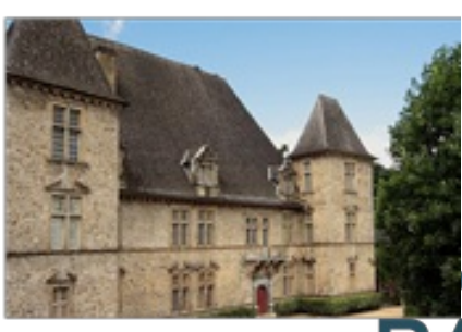
Château d'Andurain de Maytie

+33 5 59 28 04 18 +33 6 28 23 08 70 1 rue du Jeu de Paume https://www.chateaudandurain.com/