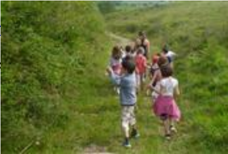
Chasse au trésor de Tardets : la saligue