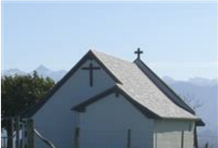
Chapelle Saint-Grégoire : panorama